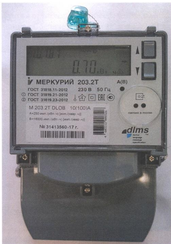
Рисунок 1а - Общий вид счетчиков с индексом D в условном обозначении с закрытой клеммной крышкой

Схема пломбировки от несанкционированного доступа, обозначение места нанесения знака поверки представлены на рисунке 2.