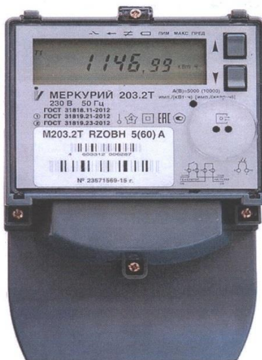
Рисунок 1 - Общий вид счетчиков с закрытой клеммной крышкой