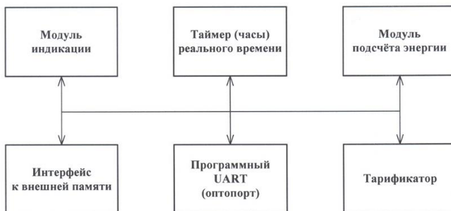
Рисунок 3 - Структура программного обеспечения «Меркурий 203.2Т»

В счетчиках используется программное обеспечение «Меркурий 203.2Т». Структура программного обеспечения «Меркурий 203.2Т» приведена на рисунке 3.